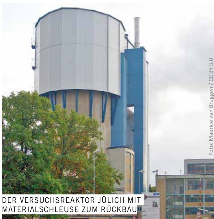
DER VERSUCHSREAKTOR JÜLICH MIT MATERIALSCHLEUSE ZUM RÜCKBAU