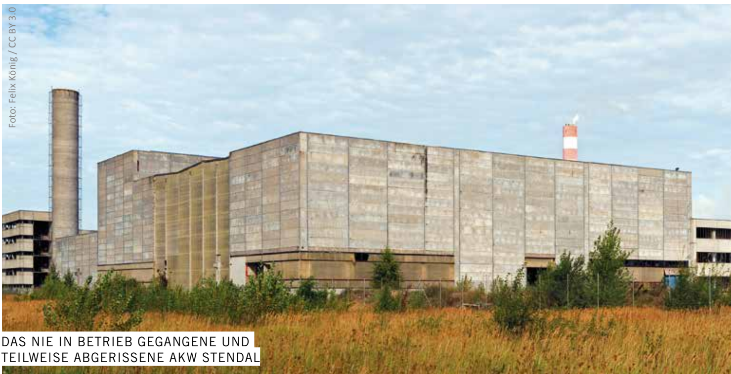
DAS NIE IN BETRIEB GEGANGENE UND TEILWEISE ABGERISSENE AKW STENDAL