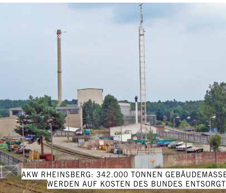
AKW RHEINBERG: 342.000 TONNEN GEBÄUDEMASSE WERDEN AUF KOSTEN DES BUNDES ENTSORGT.

Angesichts der dargestellten Sachlage fordert die deutsche IPPNW, die Option eines unbefristeten und auf Dauer angelegten Einschlusses der Atomkraftwerke zu prüfen. Zuvor müssen die stark kontaminierten Komponenten des nuklearen Kontrollbereiches einschließlich aller Brennelemente aus dem AKW entfernt werden. Sofern die Standortbedingungen am AKW und dessen Standfestigkeit es zulassen, wäre dann ganz auf den Rückbau der Atomkraftwerke zu verzichten. Das Atomgesetz sollte um diese Stilllegungs-Alternative ergänzt werden.