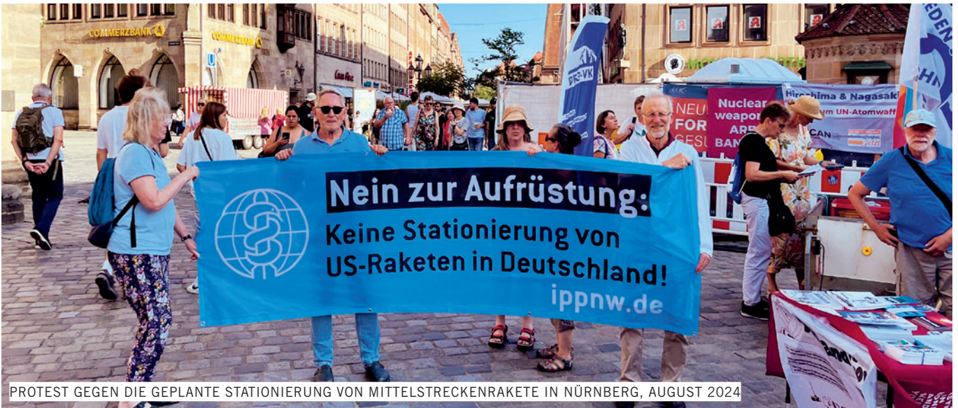
PROTEST GEGEN DIE GEPLANTE STATIONIERUNG VON MITTELSTRECKENRAKETE IN NÜRNBERG, AUGUST 2024

ger dauerhafter Stationierung“. Wie viele dieser Waffen kommen und wo genau sie stationiert werden, ist noch nicht bekannt.